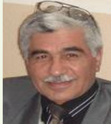
Cankurd: Ji hev