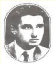
Dr. Nûrî Dêrsimî

Seidê Kurdî di parêznameya xwe ya bi navê “ Cinayet a 3’emîn a li Dadgeh a Îdareya Orfî” de dibêje “...di 1908’an de li Stenbolê 20.000 hemwelatîyên min ên hemal ên ji dilê xwe sax û saf û nezan hebûn...” ( Seidê Kurdî di sala 1908’an de bi mabesta birêxistinkirina hemalên kurd-bona ku ew serpûşê bi navê kalpak tê zanîn û ji avusturyaya ku dijberiya Osmaniyan dike tîr kirîn boykot bikin; nedin serê xwe - gelek serî diêşîne, bi wan re tê cem hev û şîretan liwan dike) 20.000 mîrên gir ên geriyayî; tevî zar û zêrç, kofî û kulfet dike 100.000 can! Di ser de 100 sal derbasbûn. Hesabdarno, de ka bijmêrin heta niha ji piştî wan çiqas mirov lihev zêde bûne? Ew tu car venegeriya “Bedlîsa şewitî” û hê îro jî li “Stembole rengîn” de bi cih û war, bi koşk û seray in... Ji wan çend kes jî kurd û Kurdistanê hayîdar in? Ew jî bimîne li alfîkî; gelo bi hebûna “hemwelatîyên xwe yê van salên dawî ji axa bav û kalan koç kirine û varoşên wan şên dikin û hê jî bi kurdîyê ve girêdayî ne,” bextewar in? Gelo ew general û siyasetmedar û karsaz û bûrokratên koka me tînin, aca me diqelînin, ûrtê me kor dikin ne ew bin?