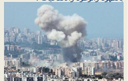
بيروت تحت النار