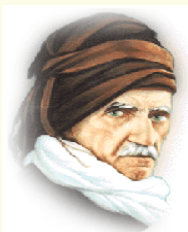
Mamoste yê navdar